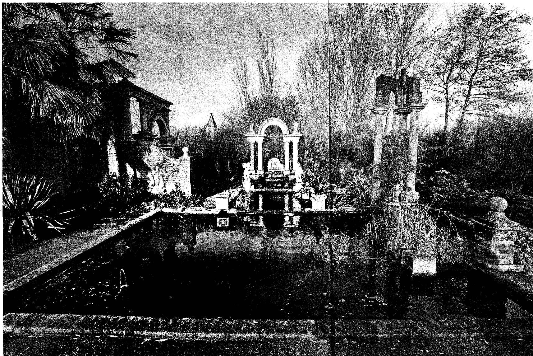
Het Romeinse bad in de Italiaanse Follytuin van Bob en Chris Goedhart in Hoogwoud.

DE FOLLY 'DE HEEREN' is een romantisch appartementje in de tuin rond Bed & Breakfast 'De Heerenhof' in Maastricht. De folly is gebouwd als tuinsieraad en te huur van 21 maart t/m 1 november voor minimaal 2 nachten, vanaf 95 euro voor 2 personen per nacht inclusief een uitgebreid ontbijt. De bijzondere tuin is zeker een bezoek waard, De Heerenhof noemt zich dan ook een Bed & Garden in plaats van Bed & Breakfast. Adres: Veldstraat 12a, 6227 SZ Maastricht, telefoon: 043-4084800. www.heerenhof.nl .